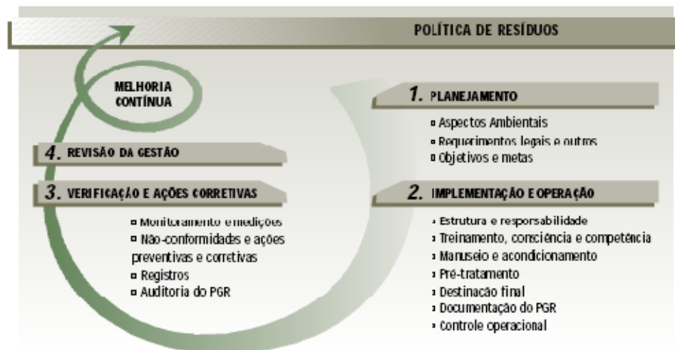
Figura 1 – Política de Gestão de Resíduos Perigosos

Na fase de PLANEJAMENTO do plano, as principais etapas estão vinculadas ao: (i) levantamento dos aspectos ambientais (os resíduos gerados); e, (ii) requerimentos legais e a definição de objetivos e metas. Estas etapas compõem os conteúdos iniciais de um plano de gestão de resíduos perigosos, com os desdobramentos a seguir: